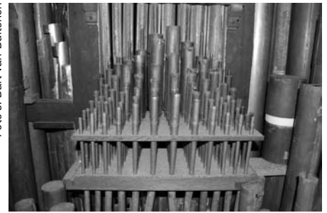
Pijpwerk Cornet, cis-zijde.