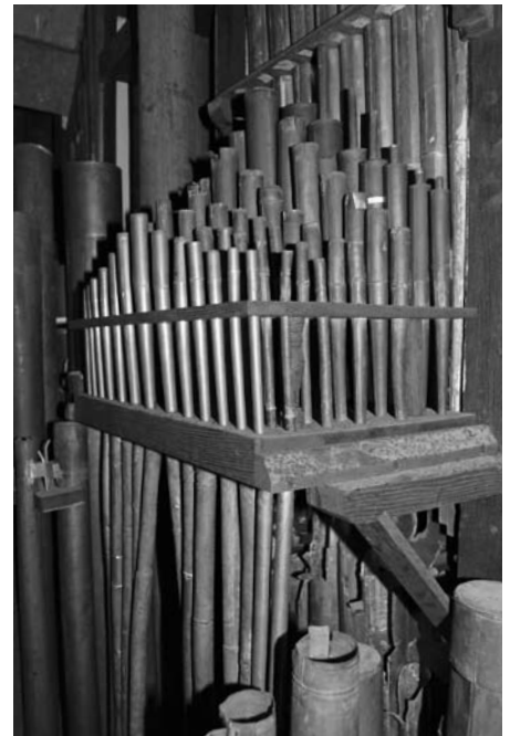
Pijpwerk Cornet, c-zijde.