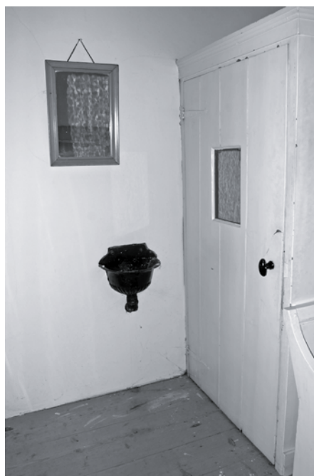
Organistenurinoir boven in de kerk van Steenberg.