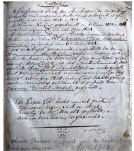
Organistenbijbel met notulen, het orgel betreffende.

Maria maakte er melding van dat het orgel was getaxeerd op f 1400 (“gelijk het effectievelijk wel waardig is”), dat het instrument haar méér had gekost en dat zij zich bereid had getoond om het voor een zeer billijke (“civile”) prijs te verkopen. De magistraat besloot haar gedeeltelijk tegemoet te komen. Zij ontving geen f 75, maar f 36. 28