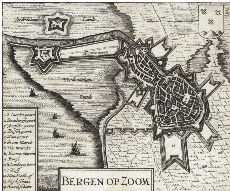
De stad Bergen op Zoom in de eerste helft van de 17 de eeuw. 113